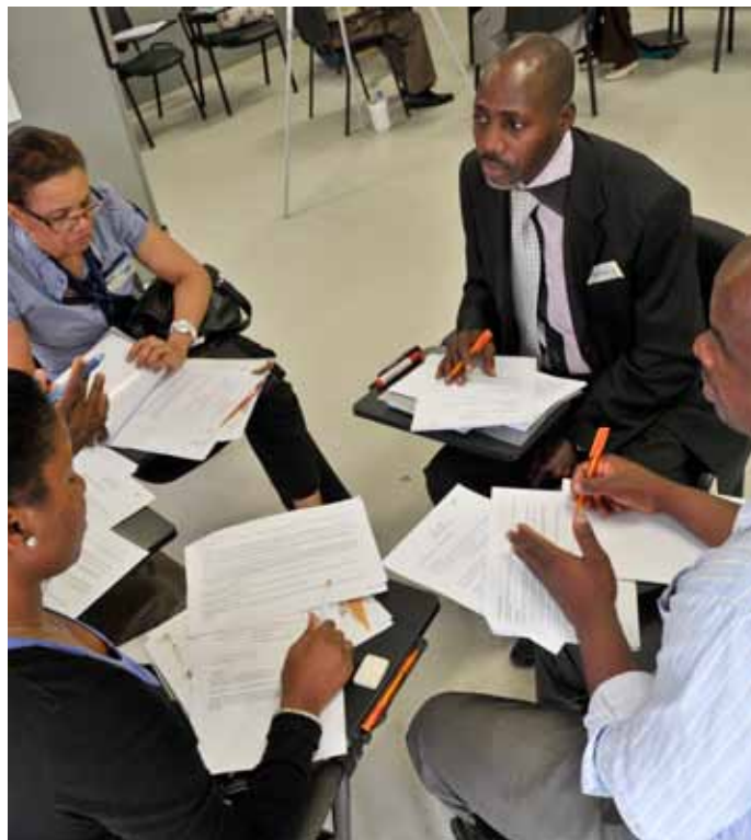
O desenvolvimento organizacional e o desenvolvimento de capacidades precisam de trocas de opiniões e experiencias

Desenvolvimento Organizacional? É a cooperação . Isto significa que uma organização deve analisar e melhorar os seguintes aspectos: Delegar tarefas e responsabilidades. Evitar a duplicação de trabalho. Motivar as pessoas envolvidas. Aumentar o desempenho dos envolvidos. Além destes aspectos, qualquer processo de desenvolvimento organizacional requer de um sistema de Monitora e Avaliação (M&A) , pois um sistema de M&A permite, primeiro, analisar a organização de forma sistemática, segundo, corrigir os procedimentos onde preciso, e terceiro, apreciar em que medida as correcções tem sido eficazes. Para informação detalhada sobre sistemas de M&A ver Newsletter 2 de 12/2011. Em Angola, o FormPRO está apoiando a três instituições no seu Desenvolvimento Organizacional: O CENFFOR, o Centro de Empreendedorismo (CE) em Viana, e o CENFOC (ver artigo “Desenvolvimento Organizacional no CENFOC”).